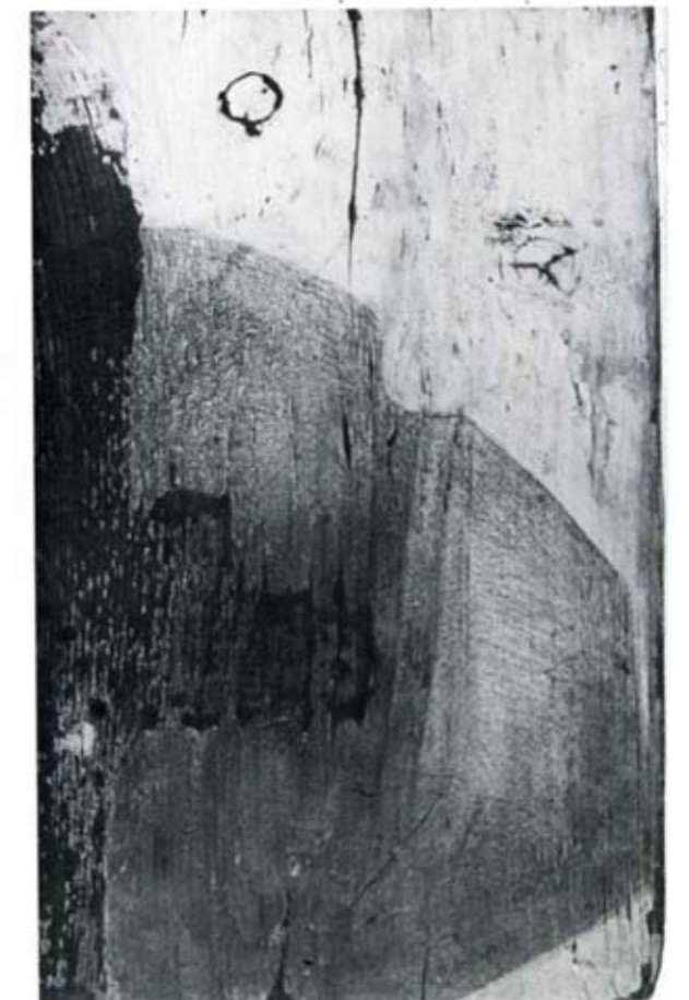
Τεσσερις λεπτομέρειες από το ίδιο θέμα, (ξύλο, λαδομπογιά, μολύβι), 17X23, 22X17, 26X17, 1977